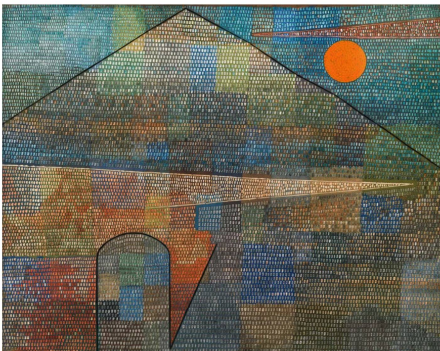
Paul Klee: «Ad Parnassum», 1932.