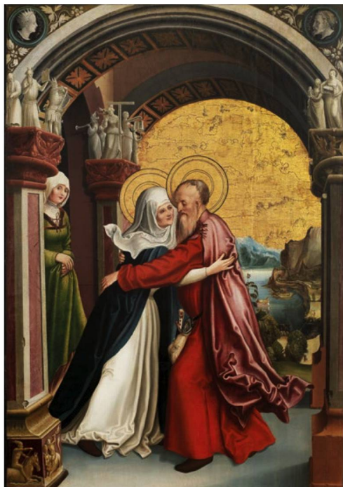
Niklaus Manuel: «Altar der heiligen Anna: Begegnung von Joachim und Anna an der Goldenen Pforte», 1515.