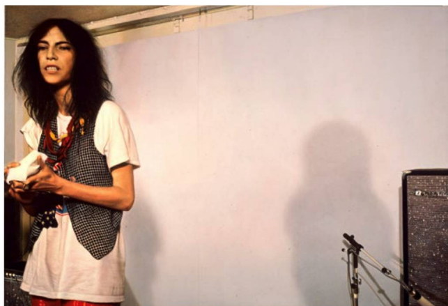
Franz Gertsch: «Patti Smith II», 1978.