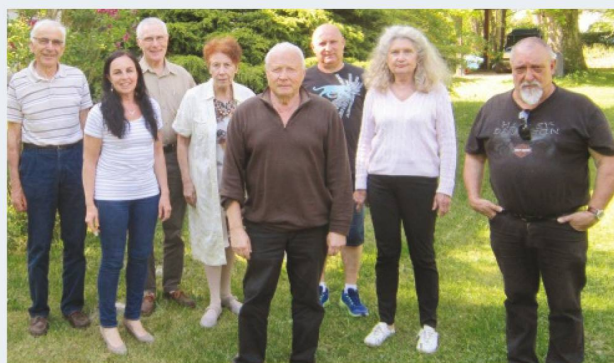
L'équipe des bénévoles qui a œuvré pour les préparatifs

En compléments des séances de travail orchestrées par l'UASF, quelques moments privilégiés ont ponctué ces trois jours de congrès : la réception officielle des congressistes par la Mairie d'Aix-les-Bains, une conférence et table ronde, une visite guidée de la ville, la soirée de gala et une croisière sur le Lac du Bourget. Le tout sous le soleil savoyard !