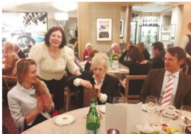
Club suisse de Monaco

TOUTE CORRESPONDANCE EST À ADRESSER AU CONSULAT GÉNÉRAL DE SUISSE À MARSEILLE.