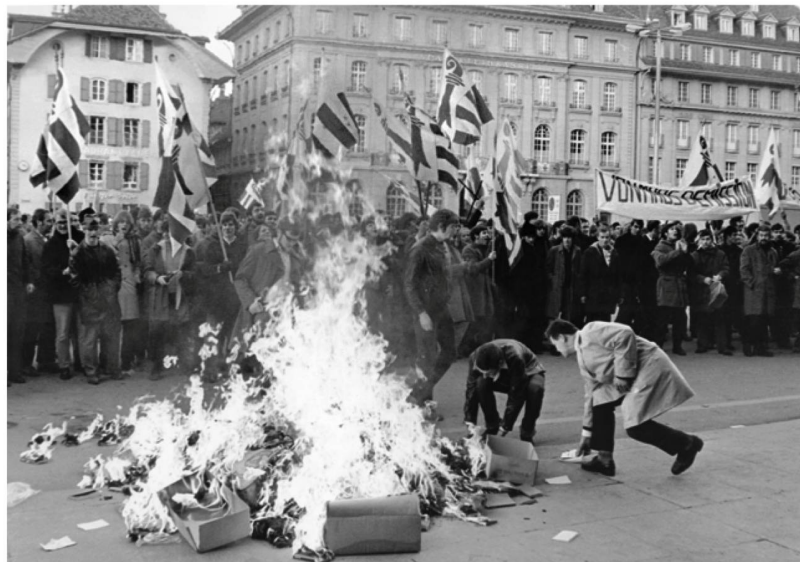
Période troublée: séparatistes jurassiens lors d'une manifestation non autorisée en novembre 1969 devant le Palais fédéral à Berne.

Rassemblement jurassien pour un plébiscite du Jura, les séparatistes ont privilégié des méthodes plus radicales dans les années 1960. Ainsi, la Journée bernoise de l'Exposition nationale de 1964 a été perturbée et le Parlement cantonal bernois, muré. Des attaques à l'explosif et des incendies criminels ont même été commis.