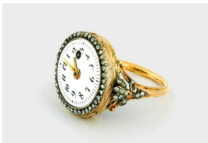
Vers 1790, il y avait aussi des bagues avec montre, comme le prouve cet exemplaire d'un horloger inconnu.