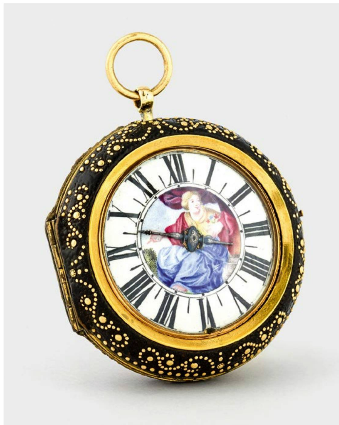
Montre avec dame noble: cet ouvrage avec boîtier et piqué doré sur cuir a été créé par Isaac Perrot vers 1690.