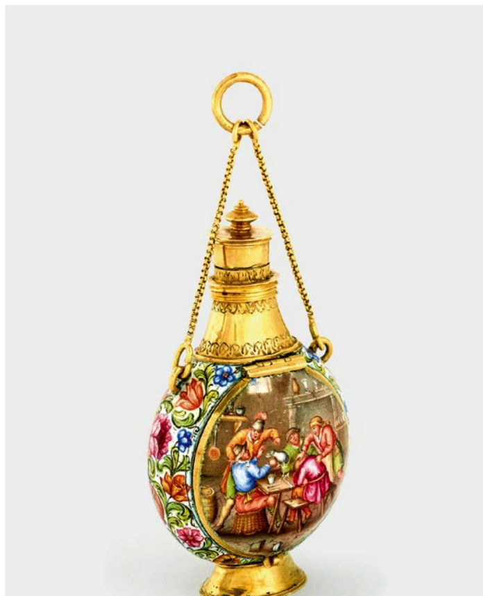
Montre en émail doré en forme de flacon de parfum, fabriquée vers 1665 par Auguste Bretonneau.