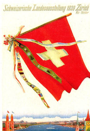
Affiche pour l'exposition Landi 39 à Zurich