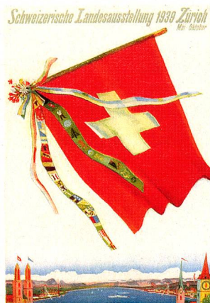
Affiche pour l'exposition Landi 39 à Zurich