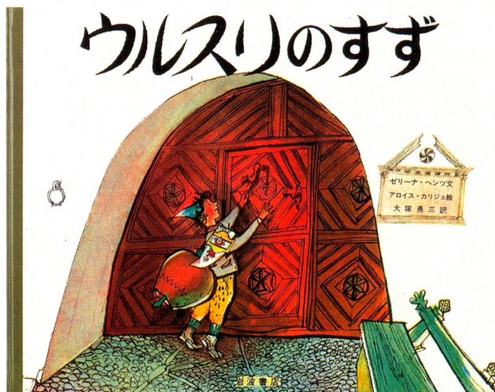
«Une cloche pour Ursli» existe aussi en japonais