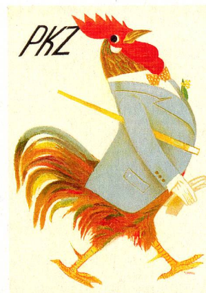
Affiche pour PKZ (1935)