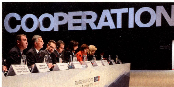
Table de la présidence dans la salle du Conseil ministériel

Pour tout renseignement complémentaire, consultez sur le site du DFAE le dossier consacré à la présidence suisse de l'OSCE: https://www.eda.admin.ch/eda/fr/home/aktuell/dossiers/osze-vorsitz-2014.html