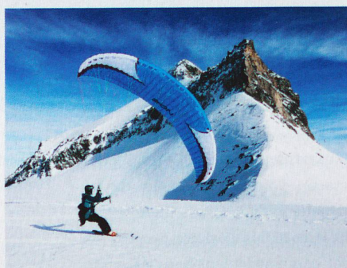
Le speed flying n'est autorisé que dans de rares régions