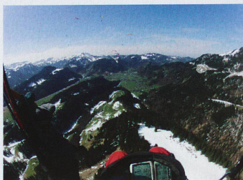
Parapentistes dans l'Alpstein

Voulez-vous voler en Suisse? Rien de plus simple, puisque le pays est truffé d'écoles de vol, de clubs et de pilotes commerciaux. Une journée d'essai avec un vol de 10 mètres coûte 120 francs, indique la FSVL. Le parapente exige un brevet, qui en général se déroule sur une année, l'idée étant de voler dans plusieurs types de conditions météo, selon cette fédération. La formation coûte environ 1800 francs et le matériel complet autour de 5000 francs. Voler sans brevet est interdit. Et la formation suisse est «poussée», estime Christian Jöhr.