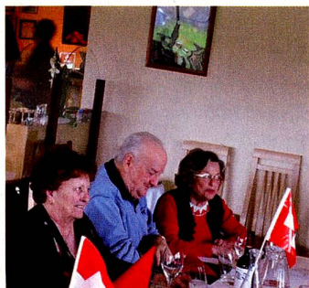
Au golf de Baden