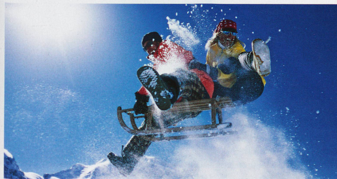
Les stations de sports d'hiver et les téléphériques promeuvent énergiquement la luge comme un plaisir pour petits et grands

Glisser le long d'un chemin ou sur une piste verglacée, seul, ou à deux, la tête en avant ou en arrière, sur une luge fixe ou dynamique: l'univers de la luge est vaste! En Suisse alémanique, la luge a deux noms: «Schlitten» ou «Rodel», ce qui n'est pas le cas en français. La première est une luge simple, du type Davos, qui coûte environ 200 francs. C'est la luge de nos souvenirs. On s'assied – ou on se couche dessus – et vogue