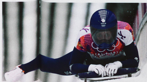
Le skeleton aux Jeux olympiques de Sotchi: Elizabeth Yarnold (GB), médaillée d'or

Il est plus facile d'apprendre à bien piloter qu'à bien pousser, ce qui explique que pas mal d'athlètes du sprint viennent à ce sport. Il faut donc beaucoup travailler le départ. Une fois en piste, ce qui compte c'est de trouver très rapidement son calme pour rester précis. C'est le mental qui compte: car plus le descendeur est nerveux, plus il va gigoter et plus il va perdre du temps.