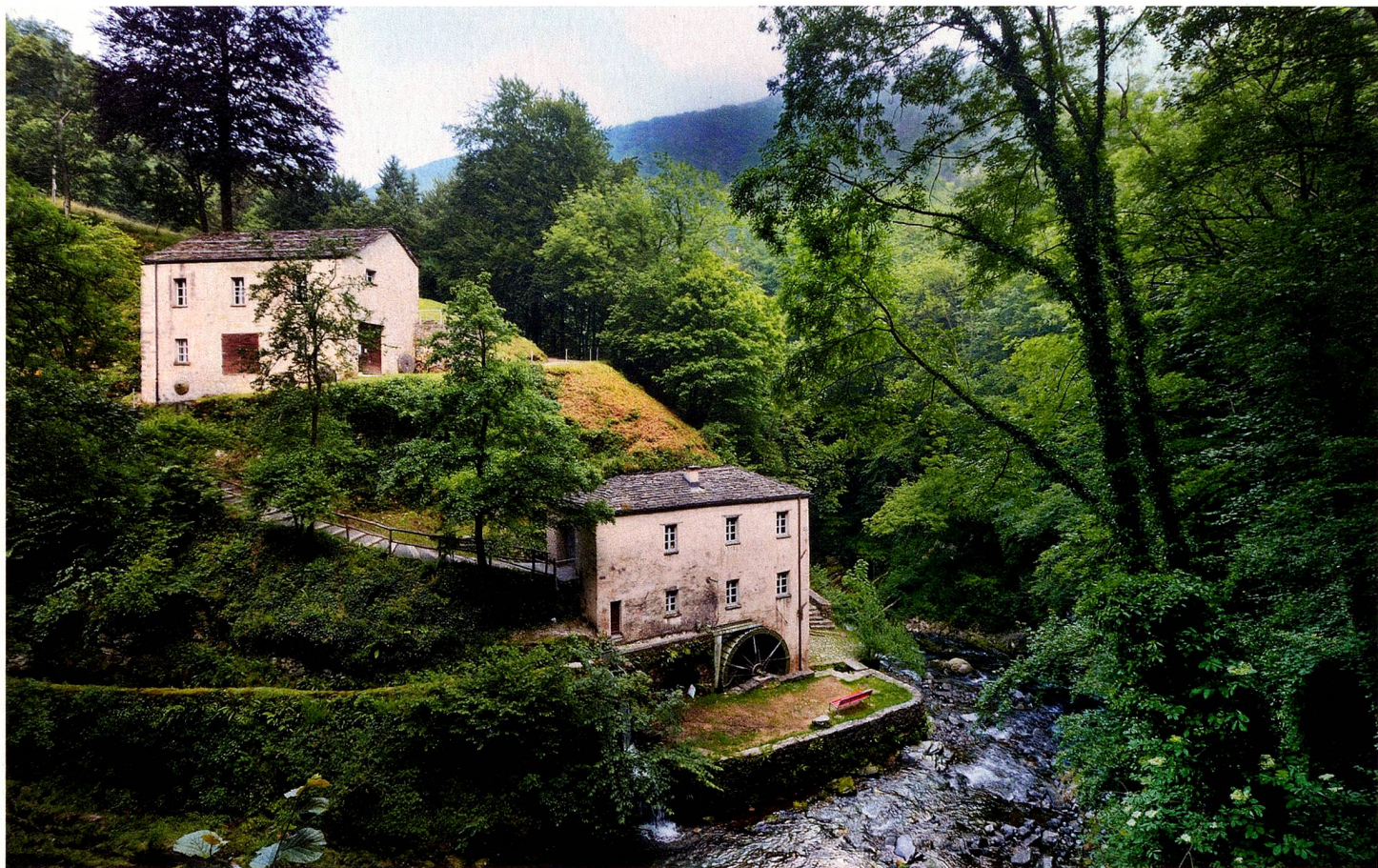
La vue sur le Monte Generoso (à g.) et le moulin de Bruzella

toute la vallée en son milieu avant de se déverser dans le lac de Côme. Ici, les stratifications des roches et les fossiles d'ammonites affichent quelque 400 millions d'années au compteur. De quoi rester humble. En amont, le pont de Castel San Pietro offre une vue époustouflante sur ce géotope d'intérêt national. Au fil de l'ascension, forêts et villages se succèdent. Caché dans les feuillus, dans un havre de paix bercé par la Breggia, le moulin à eau de Bruzella est une des perles de la vallée. «En 1983, le musée a racheté cet édifice datant du XIII e siècle et on l'a restauré pendant plus de 10 ans, conte Paolo Crivelli. Les anciens meuniers étaient encore vivants et une jeune femme du comité du musée a appris le métier de meunière. Depuis 1996, Irene Petraglio est responsable du moulin, qui a été remis en fonction. On a