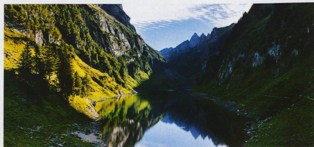
Lac de Fählen dans le canton d'Appenzell Rhodes-Intérieures avec le sommet de l'Altmann en arrière-plan