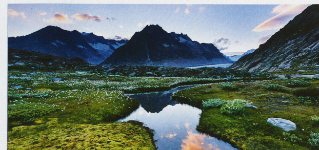
L'affluent du lac de Märgelen au bord du grand glacier d'Aletsch dans le canton du Valais.