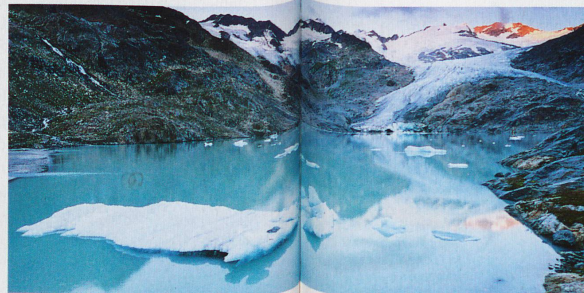
Glacier du Gault dans le canton de Berne et Märglistock à l'aube en arrière-plan