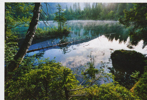
Lac de Cresta à Flims dans le canton des Grisons