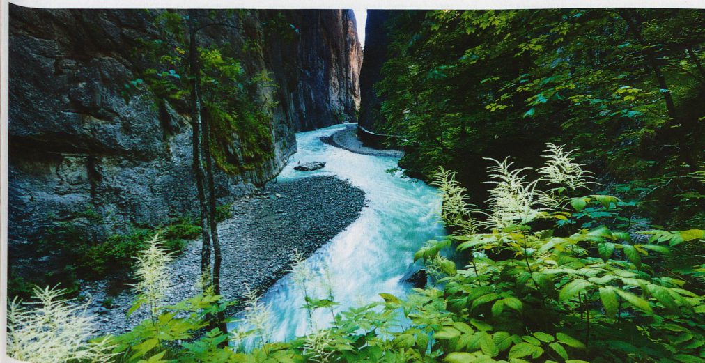
Gorges de l'Aar entre Meiringen et Innertkirchen dans le canton de Berne