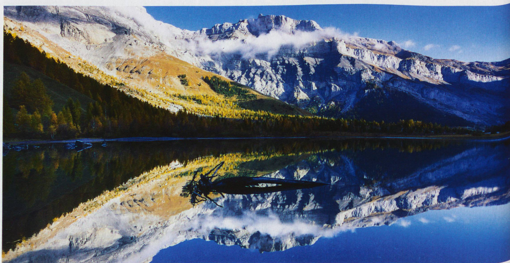
Lac de Derborence dans le canton du Valais avec l'éperon rocheux de la Tour Saint-Martin, aussi appelée Quille du Diable