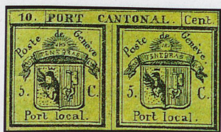
Le premier timbre suisse: le Double de Genève de 1843