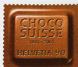
Timbre «Chocosuisse» de 2001 parfumé au chocolat.