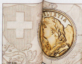
Timbre à 6 francs «Gönn'eteli», de 2013, imprimé avec de l'or 18 carats