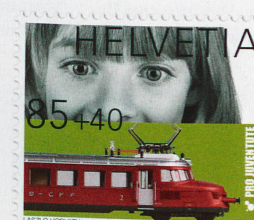
Timbre Pro Juventute de 2013 avec supplément de bienfaisance