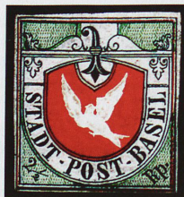
Pièce de collection onéreuse: la «Colombe de Bâle» de 1845