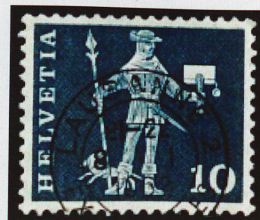
Ce timbre de 10 centimes a été imprimé à près de 1,5 milliard d'exemplaires depuis 1960