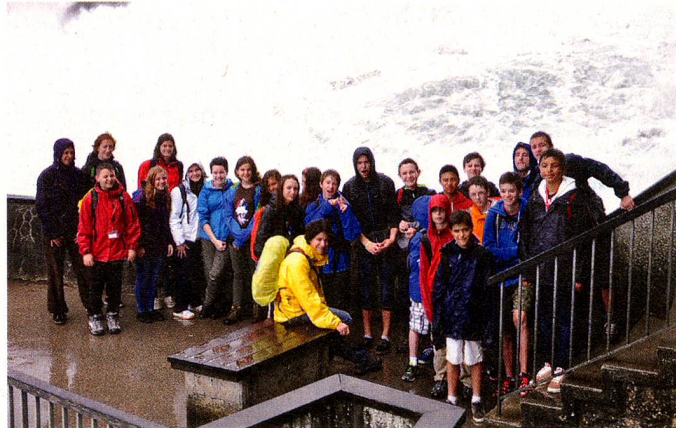
Jeunes Suissesses et Suisses de l'étranger pendant leur voyage en Suisse à l'été 2013