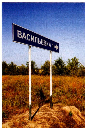
Bâle, aujourd'hui Wassiljewka: Russie Fondation: 20 août 1767 Habitants lors de sa fondation: 166 Villages voisins sur la Volga: Glaris, Lucerne, Zoug, Schaffhouse, Unterwalden, Soleure et Zurich, toutes fondées en 1767/68

PETRA KOCI «Weltatlas der Schweizer Orte»; Limmat Verlag, Zurich 2013; 288 pages avec des photographies de Benno Gut; CHF 39,50; EUR 33.-; www.limmatverlag.ch