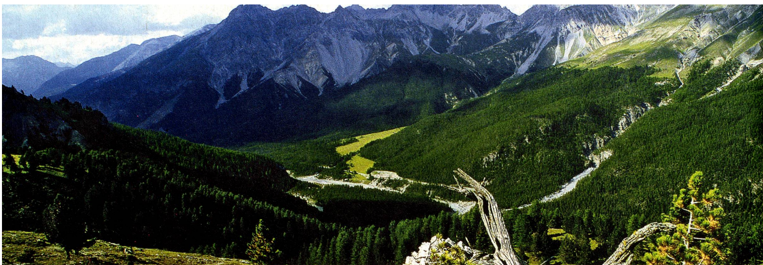
Parc National Suisse, Les Grisons