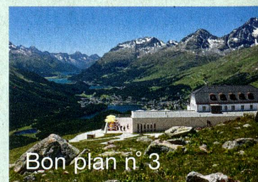
MySwitzerland.com Webcode: C58592

Dominant l'un des plus beaux panoramas de la région d'Engadine – Saint-Moritz, l'hôtel Muottas Muragl, situé à 2456 mètres d'altitude, séduit par son design alpin chic, sa large offre gastronomique et de fantastiques excursions à faire à proximité.