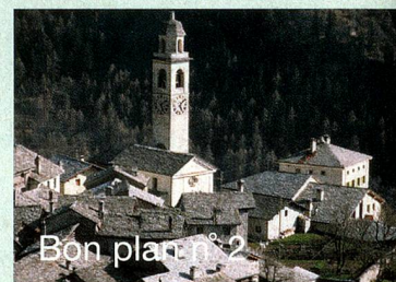
MySwitzerland.com Webcode: A147088

Le val Bregaglia dans le sud des Grisons, est un paradis pour les randonneurs et les alpinistes, mais aussi une source d'inspiration infinie pour de nombreux artistes. C'est dans cette vallée idyllique que le célèbre Alberto Giacometti a fait ses premiers pas.