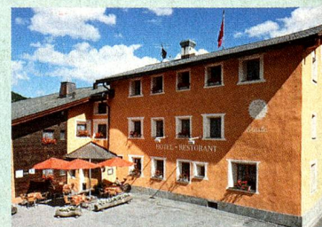
MySwitzerland.com Webcode: A54633

Hotel Staila Fuldera***, Fuldera Inscrivez-vous sur www.MySwitzerland.com/aso d'ici au 30 septembre 2013 et gagnez un séjour de 2 nuits pour 2 personnes à l'Hôtel typiquement Suisse Landgasthof Staila*** à Fuldera pour une halte passionnante dans le Val Müstair.