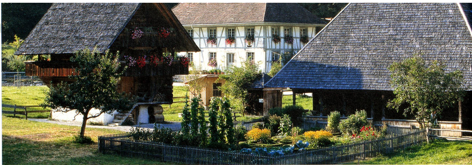
Ballenberg, le Musée suisse de l'habitat rural, Oberland bernois