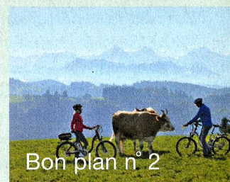
Bon plan n° 2

A travers l'Emmental, découvrez les secrets de la fabrication du célèbre fromage à trous le long d'une nouvelle route à parcourir en vélo ou en vélo électrique. Votre guide: la nouvelle appli iPhone qui indique tous les points d'intérêt de l'itinéraire.