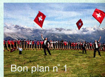
Bon plan n° 1

Chaque été, Nendaz est le théâtre enchanteur du Festival international de cors des Alpes qui accueille plus de 100 joueurs de différentes nationalités. Des stages d'initiation et visites de l'atelier de fabrication sont régulièrement organisés.