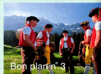
Bon plan n° 3

Dans la musique traditionnelle appenzelloise, les instruments à cordes jouent un rôle prépondérant, comme l'orgue de Barbarie ou le «hackbrett» (tympanon). Les fêtes d'alpage «Alpstobede» en été constituent autant de moments privilégiés pour l'apprécier.