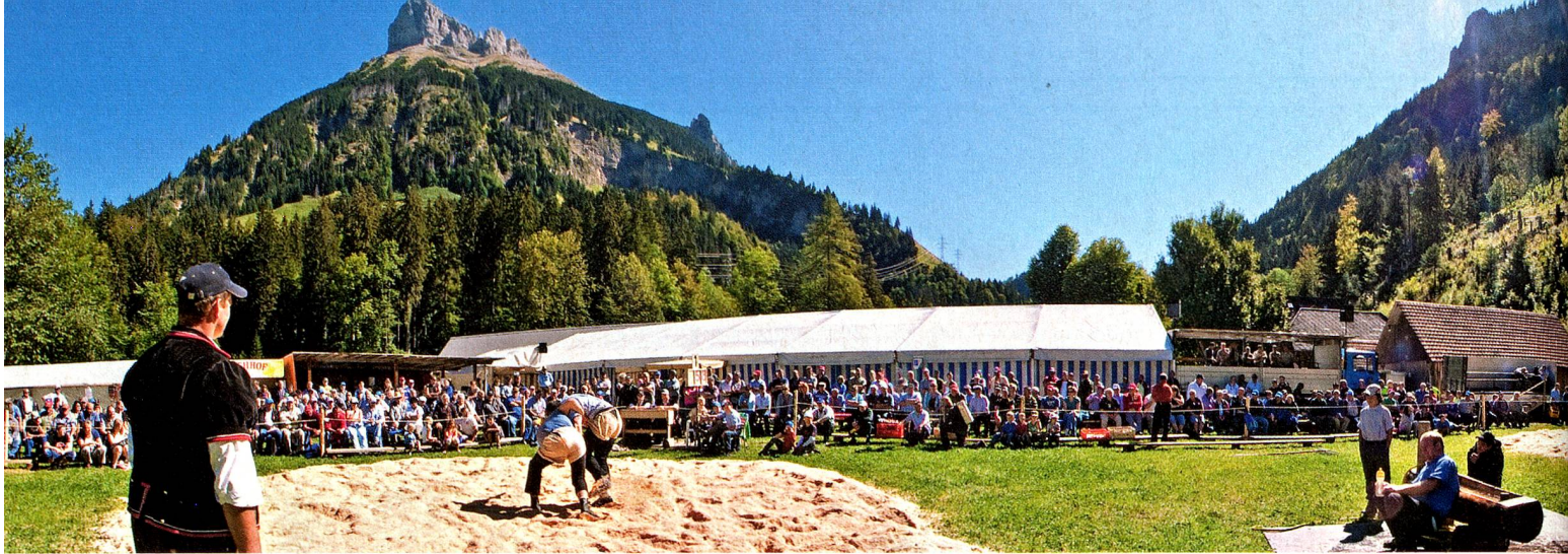
La lutte suisse, Kemmeribodenbad, Région de Berne