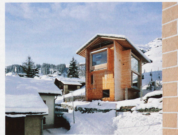
Maison édifée à Leis par l'architecte Peter Zumthor, photographiée en 2012 par Ralph Feiner