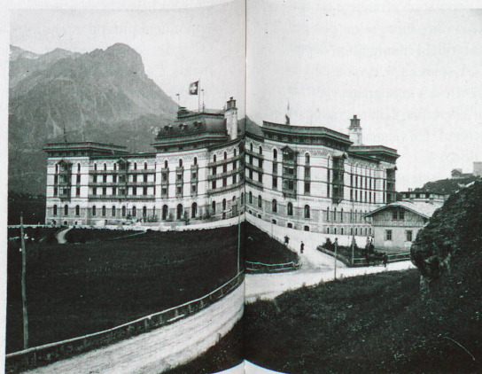
«L'Hôtel Kursaal de la Maloja», photographié début du XXe siècle par Rudolf Zinggeler