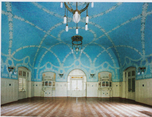
Salle à manger et salle de bal de l'établissement thermal de Bergün ouvert en 1906

Exposition: jusqu'au 12 mai 2013 au Musée des Beaux-Arts de Coire. www.buendner-kunstmuseum.ch Livre: «Ansichtssache», 150 Jahre Architektur-fotografie in Graubünden. Ed.: Stephan Kunz et Köbi Gantenbein; publié chez Scheidegger & Spiess / Bündner Kunstmuseum, 384 pages; CHF 58.-, EUR 48.-