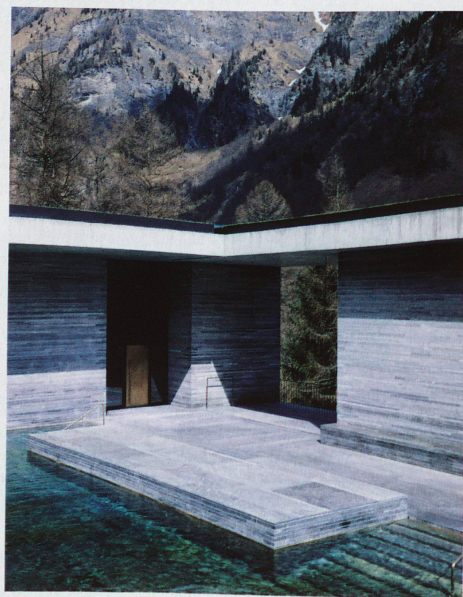
Nouveau bâtiment des thermes de Vals ouvert en 1996, conçu par l'architecte Peter Zumthor, photographié par Héliène Binet