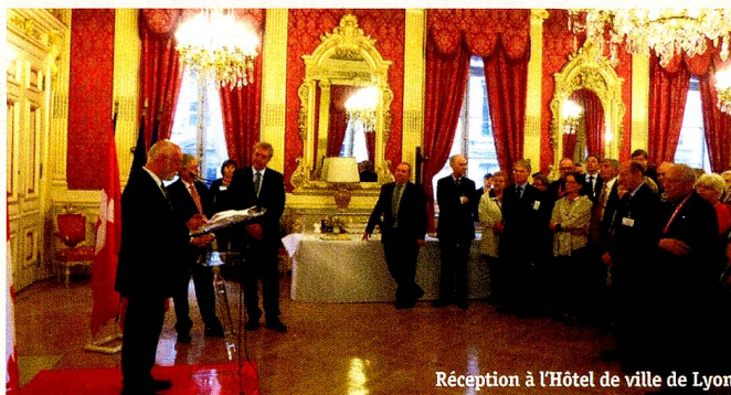
Réception à l'Hôtel de ville de Lyon

Nous avons accueilli le 55 ème congrès de l'UASF, du 26 au 29 avril, sous la présidence de Jean-Jacques de Dardel, Ambassadeur de Suisse en France. Tout commença le vendredi soir par une réception à la Mairie de Lyon. Le samedi matin eut lieu l'assemblée générale et l'après-midi la table ronde fut consacrée à la représentation politique des citoyens à l'étranger .