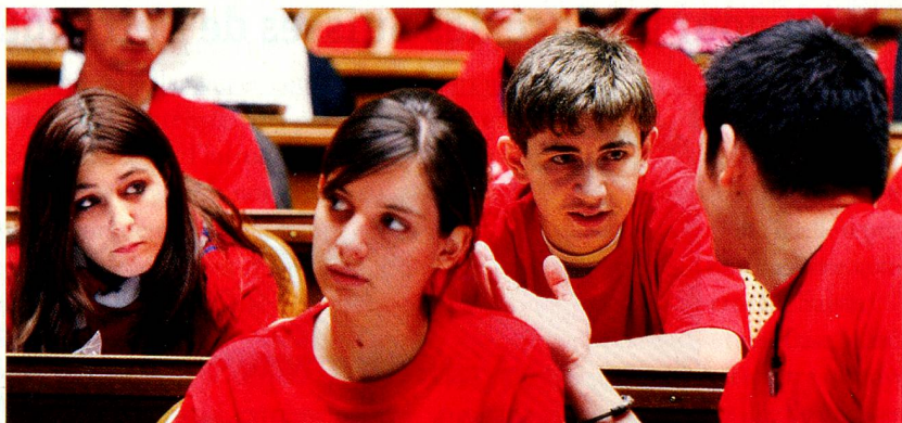
Jeunes dans la salle du Conseil national à Berne pendant la session des jeunes