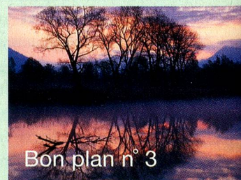
Bon plan n° 3

Les «Bolle di Magadino» constituent une splendide réserve naturelle. Ces marécages s'ouvrent sur la région du Verbano, à l'embouchure de deux cours d'eau: le Tessin et la Verzasca. Paradis de la nature, les «Bolle» abritent plus de 240 espèces d'oiseaux.