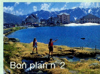
Bon plan n° 2

Un nouvel itinéraire de randonnée vous conduit aux sources de quatre grands cours d'eau européens: le Rhin, le Rhône, la Reuss (affluent du Rhin) et le Tessin (qui se jette dans le Pô). Cinq étapes en montagne pour quatre jours de marche.