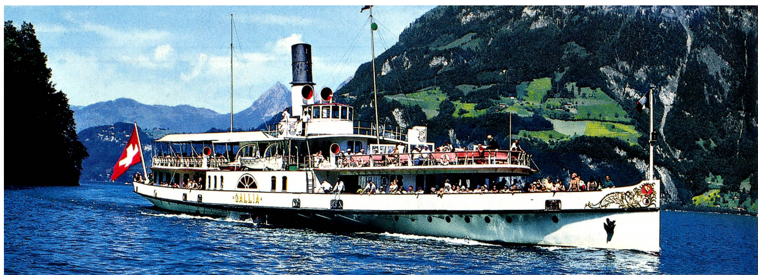
Wilhelm Tell Express sur le lac des Quatre-Cantons, Suisse centrale