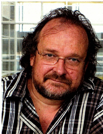
L'inventeur de la «Swatch»: Elmar Mock