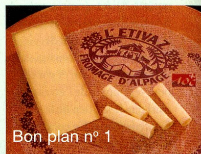
Bon plan n° 1

Pour goûter un authentique produit du terroir, faites halte à la Maison de l'Etivaz, où vous apprendrez tout sur l'Etivaz, un fromage AOC à la saveur fruitée produit chaque été artisanalement sur feu de bois dans quelque 100 cabanes de montagne.