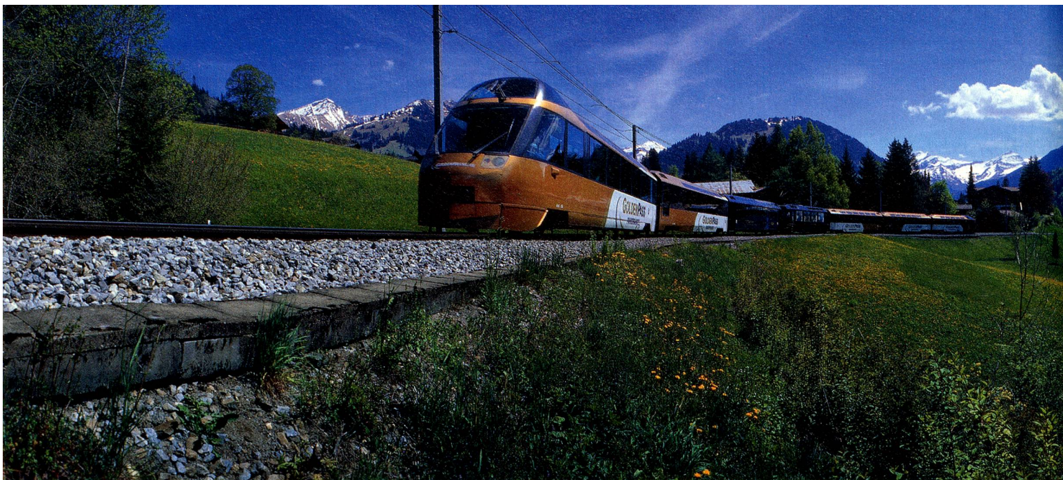
Train panoramique du GoldenPass Line, Oberland bernois