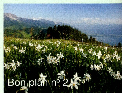
Bon plan n° 2

Au printemps, avant d'embarquer à bord du GoldenPass, il ne faut pas manquer de monter aux Pléiades, au-dessus de Vevey, pour admirer les milliers de narcisses odorants qui couvrent les champs et redescendre en plaine à toute vitesse, en trottinette.