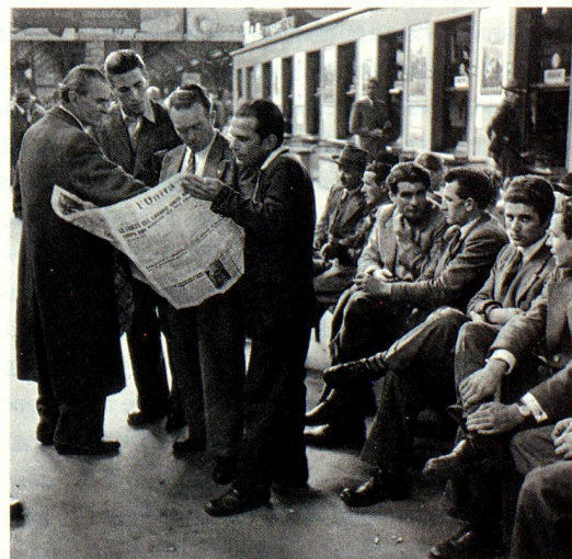
Travailleurs immigrés italiens, gare de Zurich, 1950