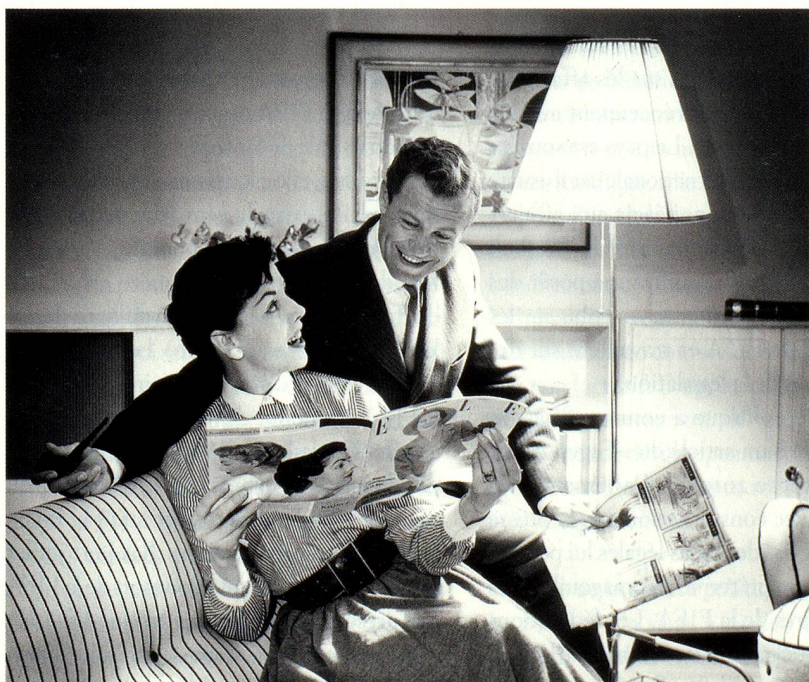
Couple modèle heureux, 1958 (sans titre)