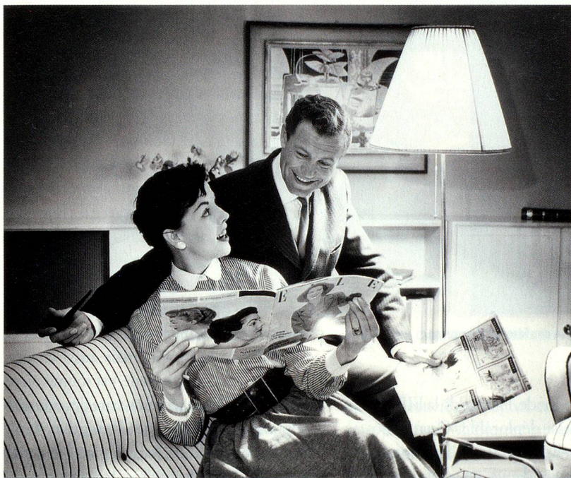
Chronologie de photos: Renault 4CV, publicité, vers 1964

«Schöner leben, mehr haben», Thomas Buomberger et Peter Pfunder; 267 pages; ISBN: 978-3-85791-649-6; prix: env. CHF 48.–