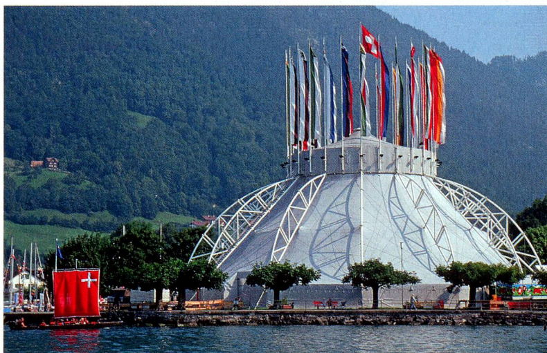
La Place des Suisses de l'étranger en 1991, avec la tente Botta dressée à l'occasion de la célébration des 700 ans de la Confédération

Le délai de remise des idées court jusqu'au 31 mars 2012. Les idées primées seront révélées au public en juillet/août à Brunnen et à l'occasion du Congrès des Suisses de l'étranger à Lausanne en août 2012.