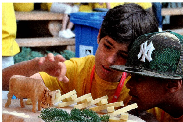
Joyeuse animation dans les camps d'été de la Fondation pour les enfants suisses à l'étranger