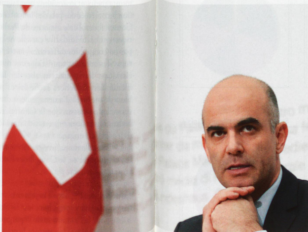
Alain Berset se présente pour la première fois à la présidence de conseiller fédéral

Après avoir été réélue sans difficulté, Eveline Widmer-Schlumpf a été largement élue par le Parlement présidente de la Confédération pour l'année en cours. Ueli Maurer est le vice-président. Didier Burkhalter est le nouveau chef du Département fédéral des affaires étrangères (DFAE). Depuis son élection au Conseil fédéral en 2009, le libéral-radical neuchâtelois dirigeait le Département de l'intérieur (DFI). Celui-ci a été repris par Alain Berset. Les autres cinq conseillers fédéraux continuent de diriger les mêmes départements qu'avant les élections.