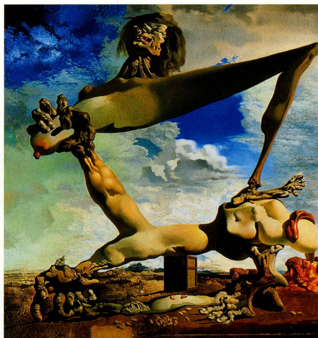
«Construction molle avec haricots bouillis: Prémonition de la guerre civile» Salvador Dalí, 1936