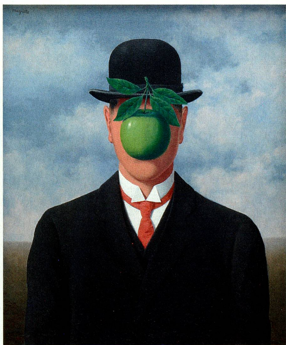
«La grande guerre» René Magritte, 1964