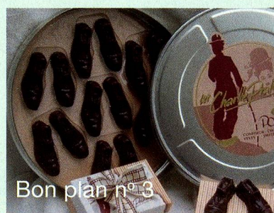
Bon plan n° 3