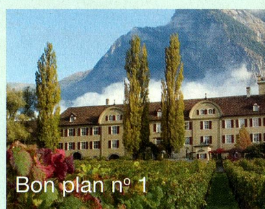
Bon plan n° 1

A Vevey, au bord du lac Léman, après une balade dans les vignes de Lavaux, arrêtez-vous chez l'artisan-chocolatier Poyet qui vous propose un tour du monde de saveurs chocolatées. En souvenir, emmenez avec vous les chaussures de Charlie Chaplin.