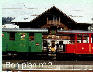
Bon plan n° 2