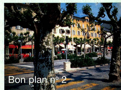
Bon plan n° 2