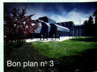
Bon plan n° 3