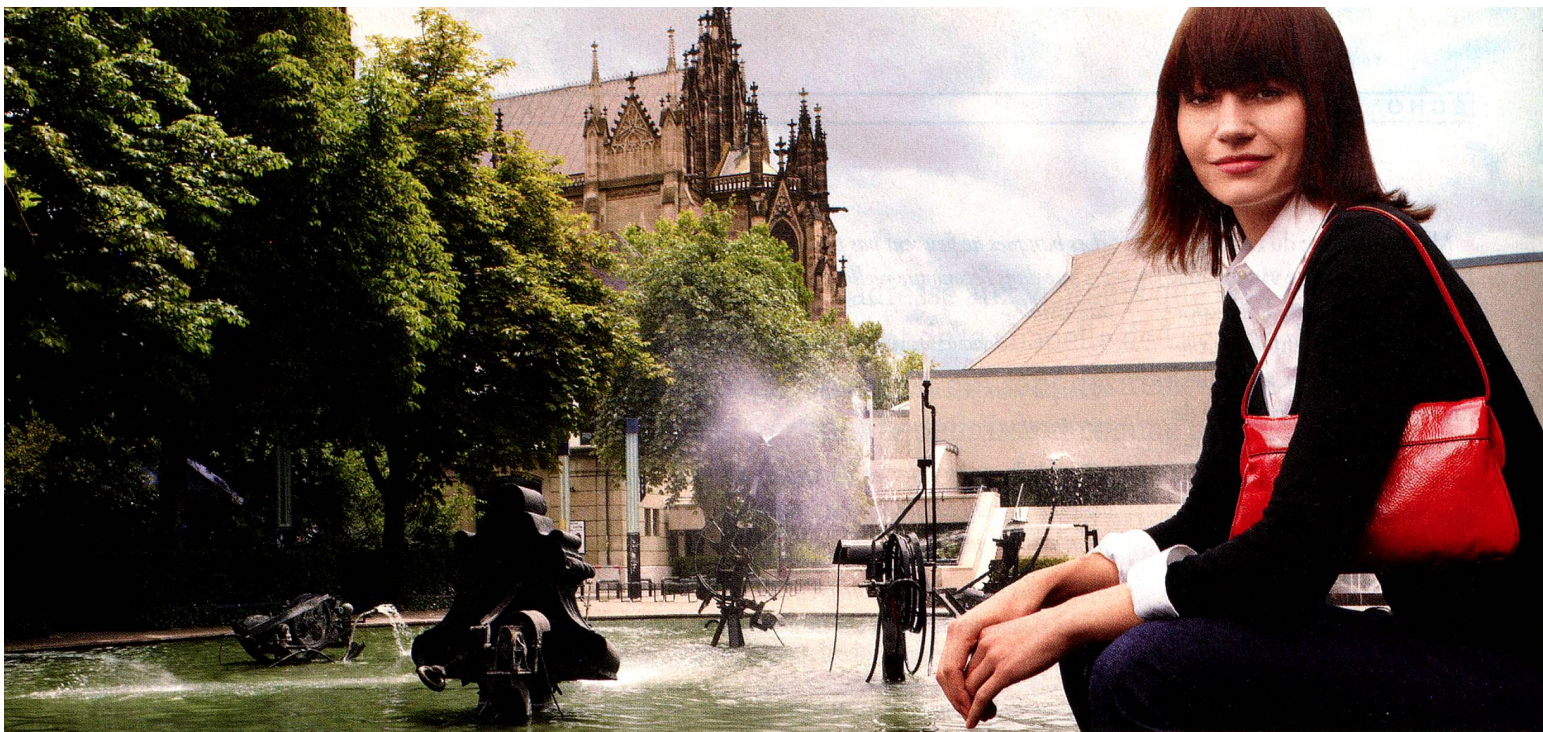
Fontaine Tinguely, Bâle