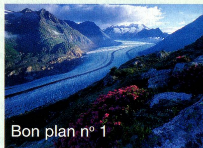
Bon plan n° 1

Le magnifique chemin de randonnée du Bettmerhorn jusqu'à Fiescheralp (Valais) surplombe un géant, le glacier d'Aletsch. Un large chemin taillé dans la roche mène en direction du lac de Märjelen, dont les environs rappellent un paysage polaire.