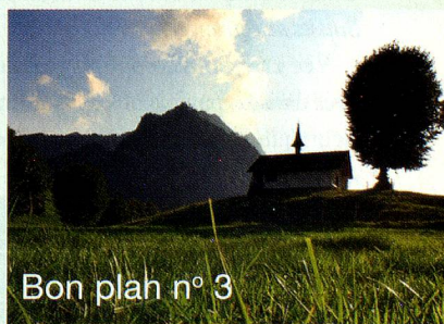
Bon plan n° 3

La petite escapade de Moléson-Village à Pringy (Fribourg) est une balade à travers la Gruyère. Sur le parcours, les fromageries de démonstration et les panneaux didactiques permettent de découvrir les secrets de la fabrication du célèbre fromage.