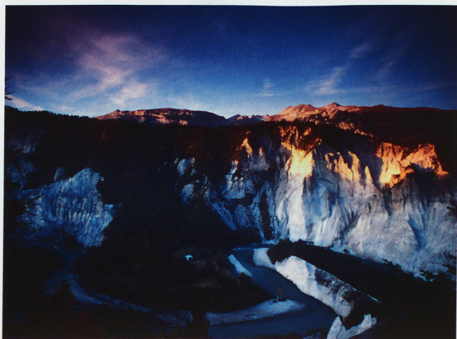
Gorges du Rhin