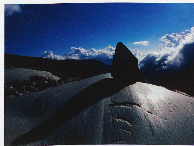
Glacier du Rhône