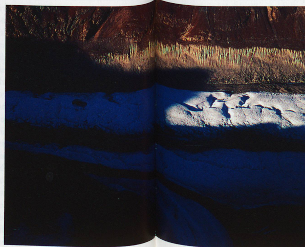
Glacier du Gorner