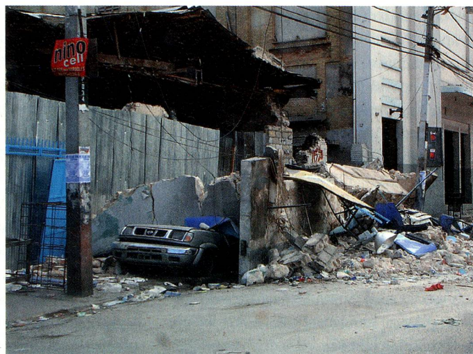
Malgré des difficultés considérables, le DFAE a pu venir en aide aux Suissesses et

Immédiatement après l'annonce du séisme, le Centre de gestion de crises de la Division politique VI du DFAE, en parallèle à l'aide humanitaire de la DDC et en étroite collaboration avec elle, a mis sur pied une cellule de crise disponible 24 heures sur 24. Peu de temps après, celle-ci a été renforcée par les autres services concernés du DFAE, du DFJP et du DDPS. La cellule de crise avait pour mission