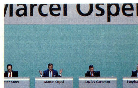
Une des photos de presse de l'année 2008: la dernière AG d'UBS de Marcel Ospel.