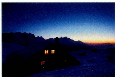
Rêver dans un chalet de rêve...

En vous INSCRIVANT jusqu'au 31 janvier 2010 au Réseau Suisse sur www.MySwitzerland.com/aso , vous participerez automatiquement au tirage au sort pour gagner un séjour pour deux personnes de 3 nuits avec petit-déjeuner dans un hôtel 3*, plus 2 x 2 forfaits de ski d'une journée à Villars Gryon.