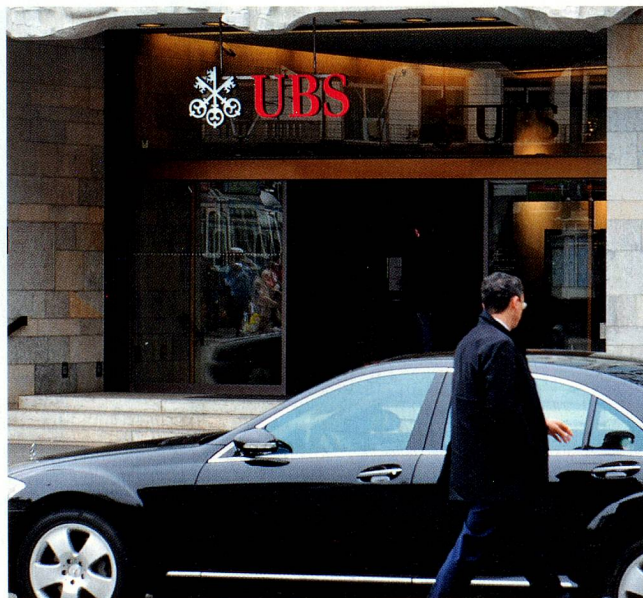
L'affaire UBS fait douloureusement souffrir la place financière suisse.

ques lui prêtent de l'argent à court terme, puis au jour le jour. Et les clients sont toujours plus nombreux à retirer leur patrimoine de la banque. La direction de la banque recherche désespérément des investisseurs privés puissants. Sans succès. En dernier ressort, elle se tourne vers l'État: dans trois courriers adressés au Conseil fédéral, à la banque nationale et à l'autorité de surveillance des banques, le président du Conseil d'administration de l'UBS demande une aide financière de 68 milliards de francs, bel aveu d'un spectaculaire naufrage. Elle reçoit de l'État une enveloppe de 6 milliards de francs (remboursables) sous forme de nouveaux fonds propres, et de la banque na-