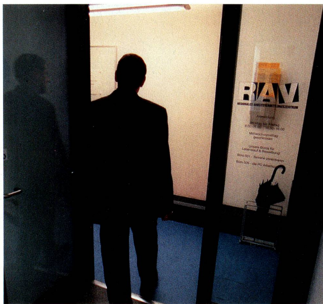
La crise financière a provoqué la suppression de milliers d'emplois. Les offices du travail connaissent à nouveau une activité fébrile.

Centre de documentation: www.doku-zug.ch