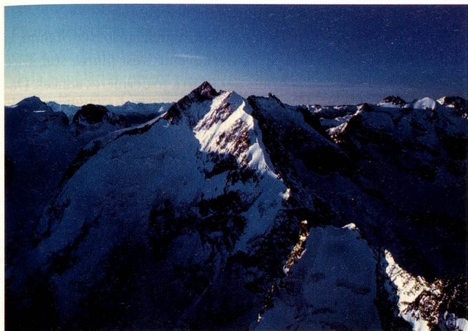
Piz Bernina, 4049 m

« Altitude 4000 », tel est le nom de la magnifique collection d'images qui présente le portrait des 35 plus beaux et plus impressionnants sommets alpins suisses de plus de 4000 mètres. Les deux photographes Maurice Schobinger et Pierre Abramowski se sont fixés pour objectif de photographier les plus hautes montagnes de Suisse de façon homogène à 4000 mètres d'altitude et à trois kilomètres de distance. Et le résultat est du plus bel effet. Ce livre est paru en allemand, français et anglais. Il est disponible au prix de CHF 59.—.