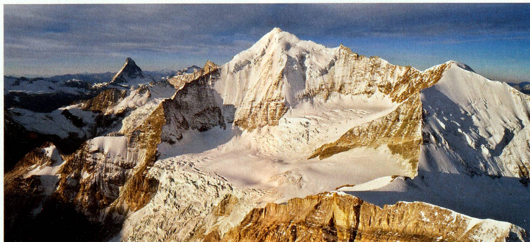
Weisshorn, 4506 m