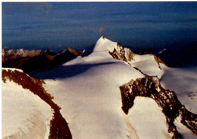
Allalinhorn, 4027 m