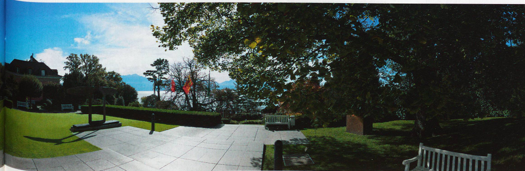
Le Musée Olympique de Lausanne est situé dans un parc de 22'000 m 2 .

outre les maîtres mots des expositions permanentes puisqu'il est même possible d'emprunter un baladeur mp3 qui conte chaque étape de la visite dans une multitude de langues.