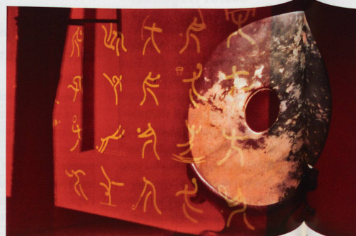
Coup d'œil à l'exposition temporaire sur les Jeux Olympiques de Pékin: le stade olympique, les pictogrammes des différentes disciplines et les médailles avec un disque de jade incrusté.