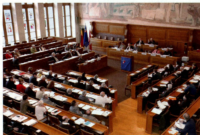
.....s'est réuni à l'Hôtel de ville de Berne.