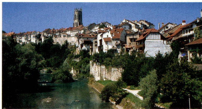
Le prochain Congrès des Suisses de l'étranger aura lieu dans la magnifique ville de Fribourg.

La propre expérience du canton de Fribourg en matière de flux migratoires rend encore plus