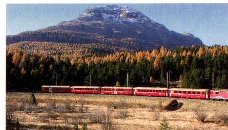
Le chemin de fer rhétique – tiré de la publication «Les plus beaux moyens de transport de Suisse» (page 7).