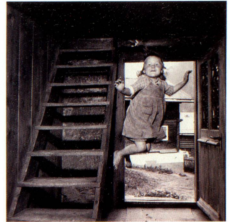
Le saut, 1955, photo de Theo Frey.