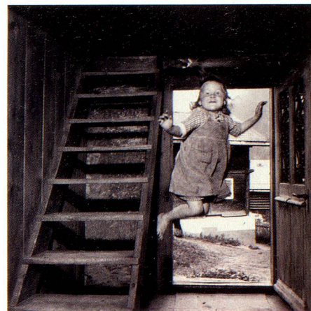
Le saut, 1955.