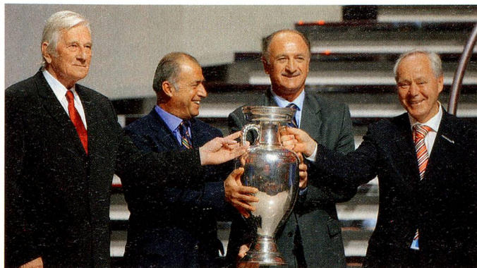
TIRAGE AU SORT DU CHAMPIONNAT D'EUROPE DE FOOTBALL 2008: de droite à gauche, l'entraîneur de l'équipe nationale suisse de football Jakob «Köbi» Kuhn, l'entraîneur du Portugal Felipe Scolari, l'entraîneur de la Turquie Fatih Terim et l'entraîneur tchèque Karel Brueckner tiennent le trophée pendant le tirage au sort final de l'Euro 2008 à Lucerne, le 2 décembre 2007.

Le compte à rebours final a débuté. L'équipe de Suisse