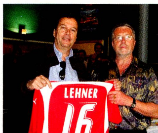
Remise du maillot suisse à notre Président d'honneur