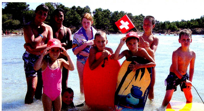
Les "forces vives" de l'amicale les pieds dans l'eau, au soleil.