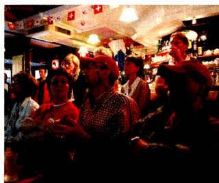
Chaude ambiance pendant l'Euro au "Vin Bis"