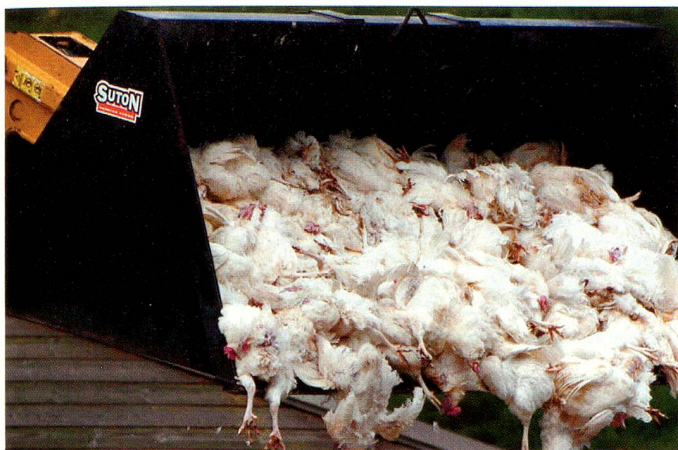
Abattage d'urgence de poulets en Angleterre, en avril 2006.

Géorgie, Guatemala, Honduras, Hong Kong, Inde, Indonésie, Iran, Israël, Jamaïque, Jordanie, Kenya, Koweït, Laos, Liban, Libye, Macédoine, Malaisie, Maroc, Ile Maurice, Mexique, Monténégro, Nicaragua, Sultanat d'Oman, Pakistan, Paraguay, Pérou, Philippines, Qatar, République dominicaine, Roumanie, Russie, Serbie, Singapour, Sri Lanka, Taïwan, Thaïlande, Tunisie, Turkménistan, Ukraine, Uruguay, Vénézuëla, Viêt Nam DFAE, DIVISION POLITIQUE VI