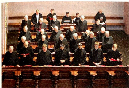
Moines en prière.