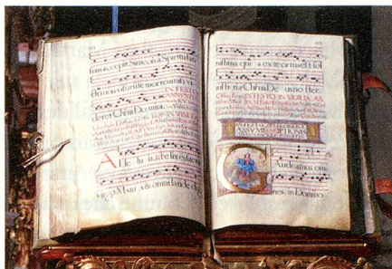
Manuscrit de la bibliothèque.