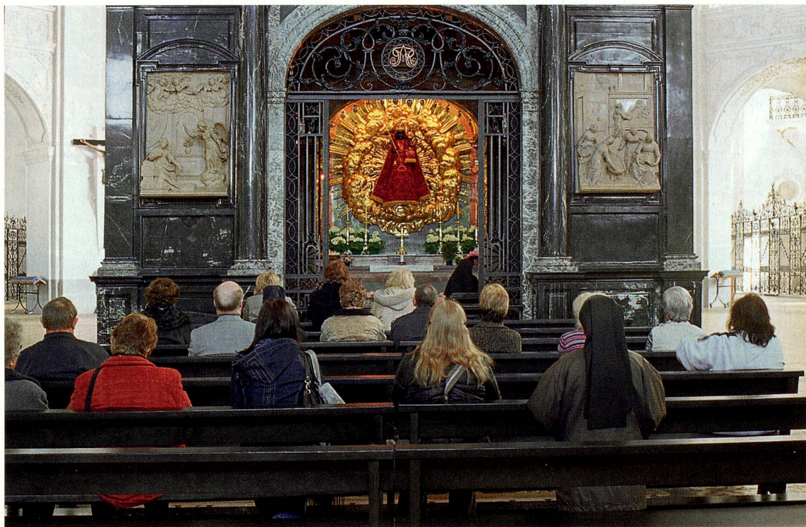
Un but de pèlerinage: la Madone noire d'Einsiedeln, dans la basilique.