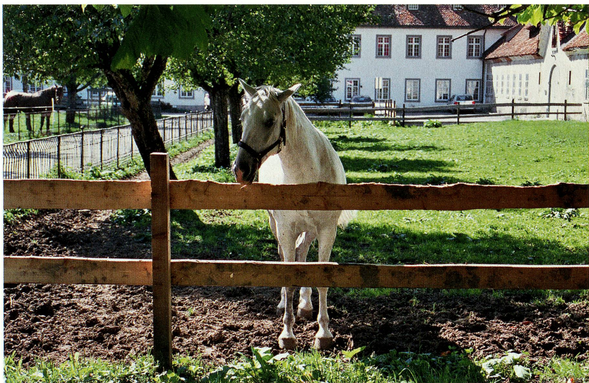
Le haras d'Einsiedeln est le plus vieux d'Europe.

ments pour l'équitation.» Les anciennes écuries datant de 1768 sont en train d'être complètement rénovées et les artisans du monastère (menuisiers, serruriers, maçons, peintres, etc.) sont à l'ouvrage. Les rénovations seront terminées à fin 2008. Côté personnel, une vétérinaire vient plusieurs fois par semaine, une éleveuse d'expérience dirige les écuries et quatre employés s'occupent des chevaux et des cours d'équitation. L'élevage d'Einsiedler a traversé un millénaire avec différents croisements tout en gardant le caractère sportif de ce splendide cheval dont les racines historiques datent du X e siècle.