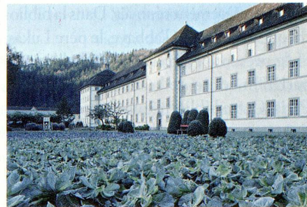
L'abbaye subvient à ses propres besoins.