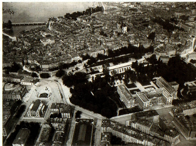
Genève, la vieille ville avec le Parc des Bastions et la cathédrale, vus du sud-ouest.