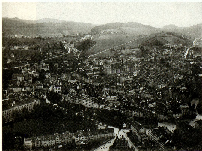
Saint-Gall, la vieille ville, 1893?