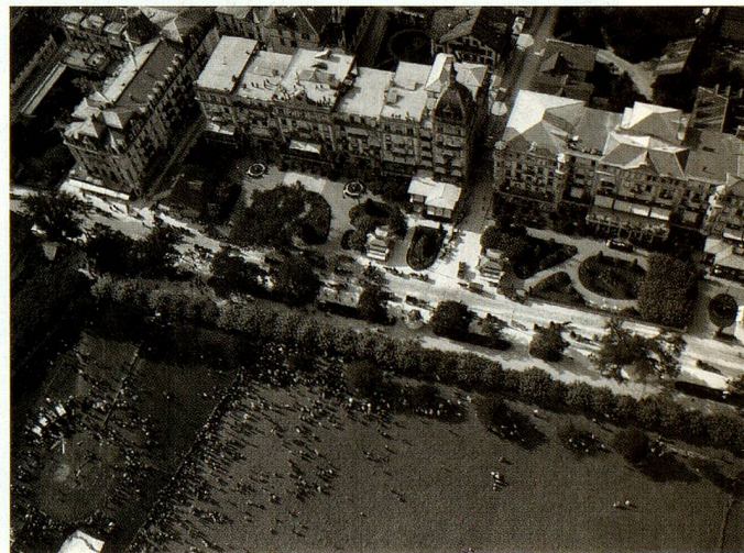
Interlaken avec le site de décollage du ballon.