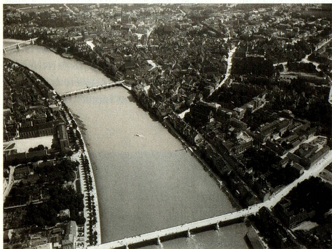
Bâle et les ponts sur le Rhin, vus du nord.