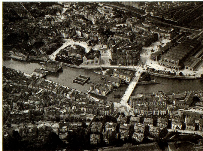
Zurich, la vieille ville et la gare centrale, vus de l'est, 1909/1910.