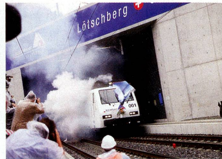
Le chantier de la NLFA à Mittholz (à gauche). Le chantier du portail à Rarogne, près du Rhône, en Valais (au centre). Fête d'inauguration, le 15 juin 2007, également à Rarogne (à droite).

Le tunnel de base du Lötschberg a été inauguré officiellement le 15 juin de cette année. Mais il ne sera totalement exploité que lors du changement d'horaire en décembre. De nombreuses personnalités nationales et internationales ont assisté à l'inauguration, dont le conseiller fédéral Moritz Leuenberger. «Le tunnel du Lötschberg est, en toute admiration pour l'exploit technique et la grande prestation de toutes les personnes impliquées, bien plus qu'un impressionnant trou dans la montagne», a déclaré le ministre des transports. Il représenterait en effet «la concrétisation cohérente de la politique suisse de transfert sur le rail du trafic routier, qui sert aujourd'hui de modèle dans toute l'Europe».