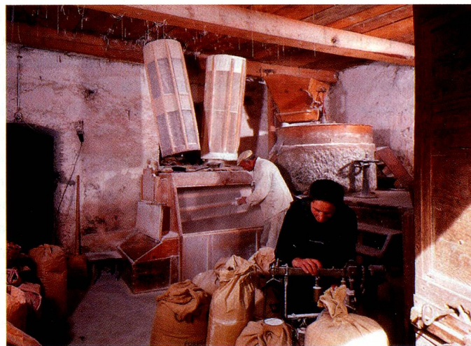
Moulin à grains à Poschiavo.