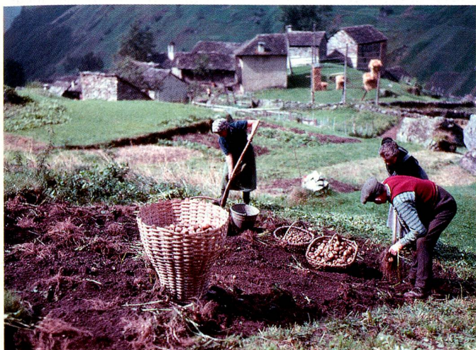
Ramassage de pommes de terre à Malvaglia.