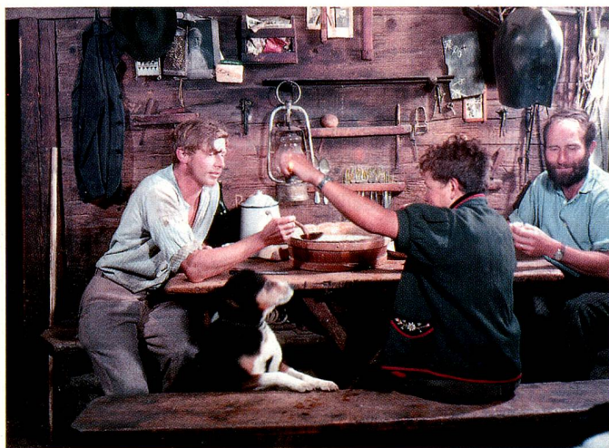
«Suifi», boisson à base de petit-lait, sur l'alpage de Gummen, à Nidwald.