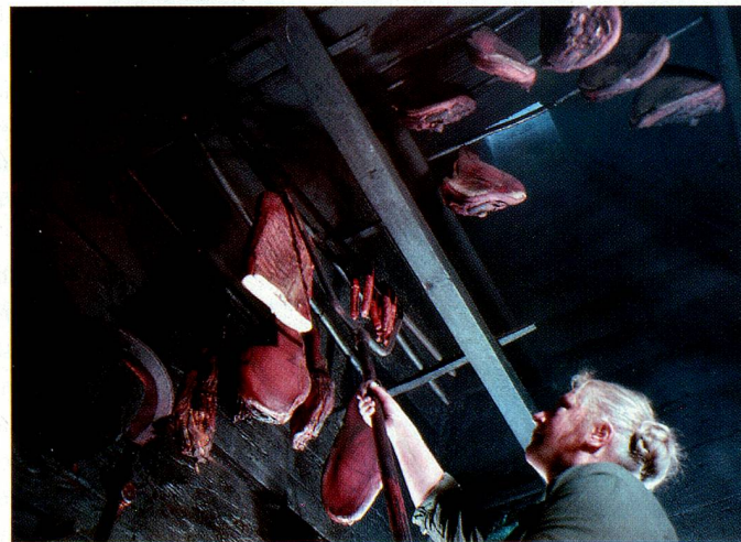
Fumoir dans le Val d'Illier.