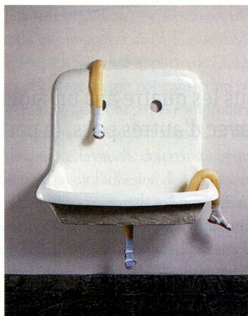
Robert Gober, Untitled, 1999-2000 Argile, cire d'abeille, cheveux humains, coton, cuir, languettes en aluminium, peinture laquée