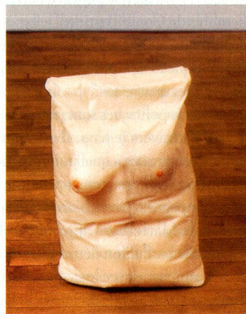
Robert Gober, Untitled, 1991 Bois, cire d'abeille, cuir, tissu et cheveux humains