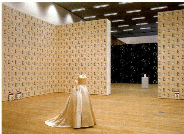
Robert Gober, Untitled 1989, Installation