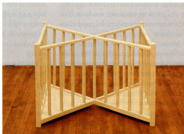
Robert Gober, X Playpen, 1987, Bois et peinture laquée