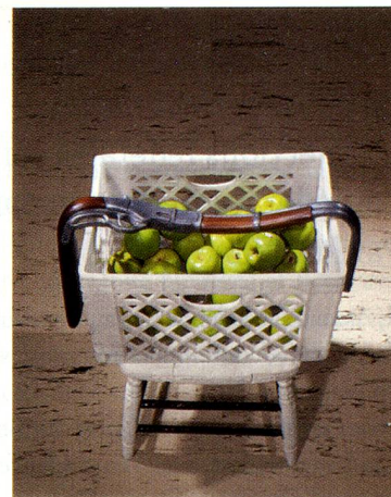
Robert Gober, Melted Rifle, 2006 Plâtre, peinture, coulage en plastique, cire d'abeille, bois de noyer, plomb