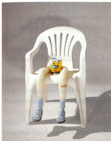
Robert Gober, Untitled, 2005-2006, Grès, cire d'abeille, coton, cuir, languettes en aluminium, cheveux humains, coulage en cristal à l'oxyde de plomb, papier d'aluminium, peinture à l'huile et peinture acrylique

Robert Gober au Schaulager. Le Schaulager de Münchenstein, situé aux portes de Bâle, accueille jusqu'au 14 octobre la rétrospective à ce jour la plus complète sur l'artiste américain Robert Gober. L'exposition compte 40 sculptures, 5 installations de grande taille et plusieurs séries de dessins datant des trois dernières décennies, particulièrement fascinants. www.schaulager.org