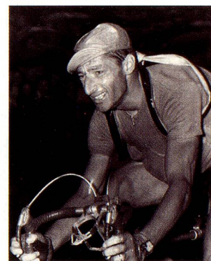
Indestructible: Ferdy Kübler